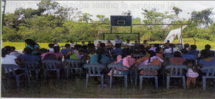
Reunión con los dirigentes y dirigentes de las comunidades

Conforme lo establece el COOTAD en su Artículo 238, las prioridades de gasto se establecerán desde las básicas de participación y serán recogidas por la asamblea local o el organismo que en cada gobierno autónomo descentralizado se establezca como máxima instancia de participación.